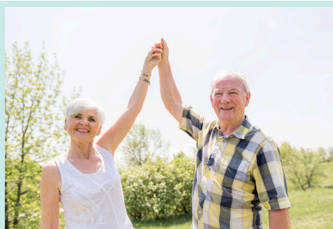
Aumento del Haber