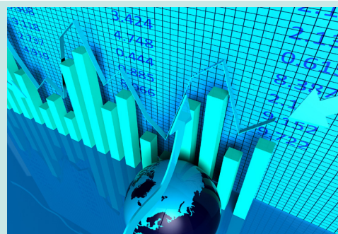
Conferencia Mercado de Capitales

Acompañamos tu presente, cuidamos tu futuro