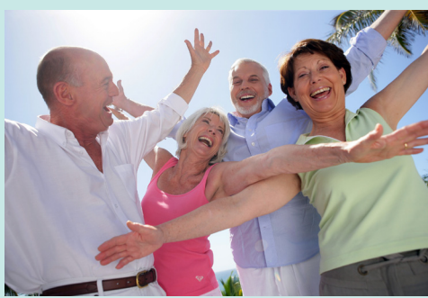
Cronograma de Actividades