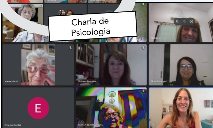
Charla de Psicología