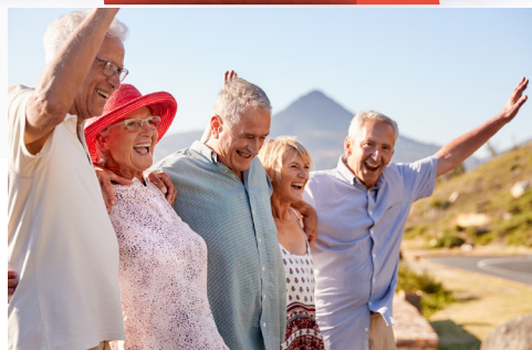
CIERRE DE ACTIVIDADES 2021