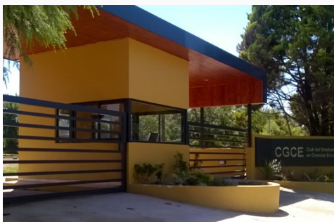
CONVENIO CON EL CLUB DEL GRADUADO