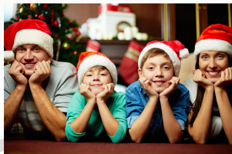
LA CAJA LES DESEA ¡FELICES FIESTAS!

ACOMPañAMOS TU PRESENTE, CUIDAMOS TU FUTURO