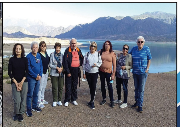
Salida a Mendoza

Ingresa a https://cpscba.org.ar/recreacion/ y podrás visualizar los videos de todo el año