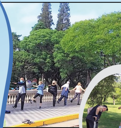
Gimnasia para adultos

Con dichas jornadas damos por finalizado el año 2021, informándoles que a partir del mes de febrero 2022 reiniciaremos las actividades. ¡Los esperamos!