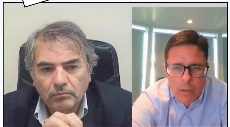
Ciclo de conferencias "La Caja con Vos"