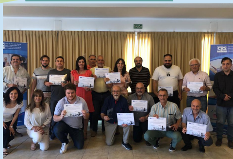
3° TORNEO DE AJEDREZ PRESENCIAL