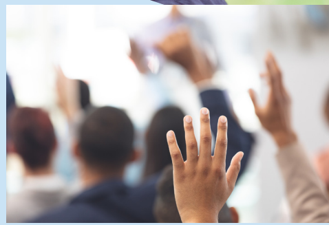
CONVOCATORIA A ASAMBLEA ORDINARIA

ACOMPañAMOS TU PRESENTE, CUIDAMOS TU FUTURO