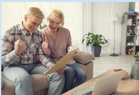
AUMENTO DEL HABER A PARTIR DE DIC-22