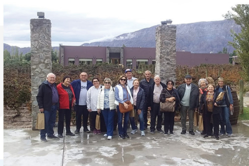
SALIDA GRUPAL A TALAMPAYA

ACOMPañAMOS TU PRESENTE, CUIDAMOS TU FUTURO