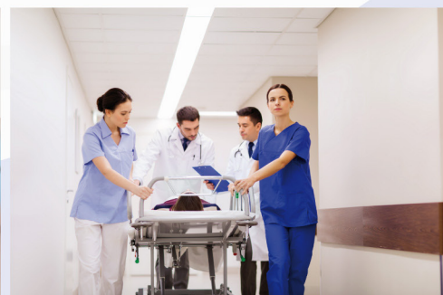
SUBSIDIO POR ENFERMEDAD

Av. Hipólito Yrigoyen 490 - Nva. Córdoba - Córdoba - Argentina