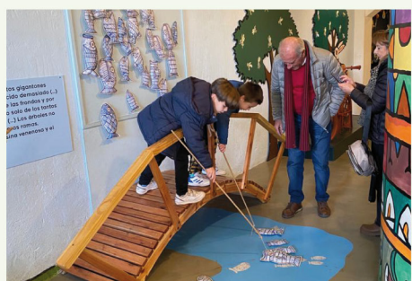
Museo Barrilete 2023