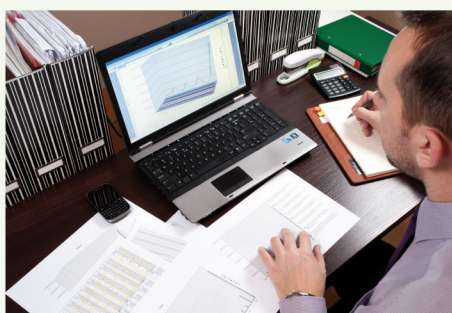
Cambiá de categoría y aumentá tu futuro haber