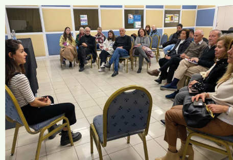
Charla abierta de fotografía

ACOMPAÑAMOS TU PRESENTE, CUIDAMOS TU FUTURO