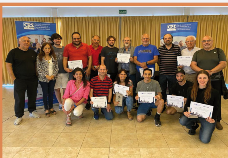
4° Torneo de Ajedrez