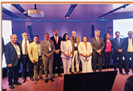
82° Plenario de la Coordinadora de Cajas