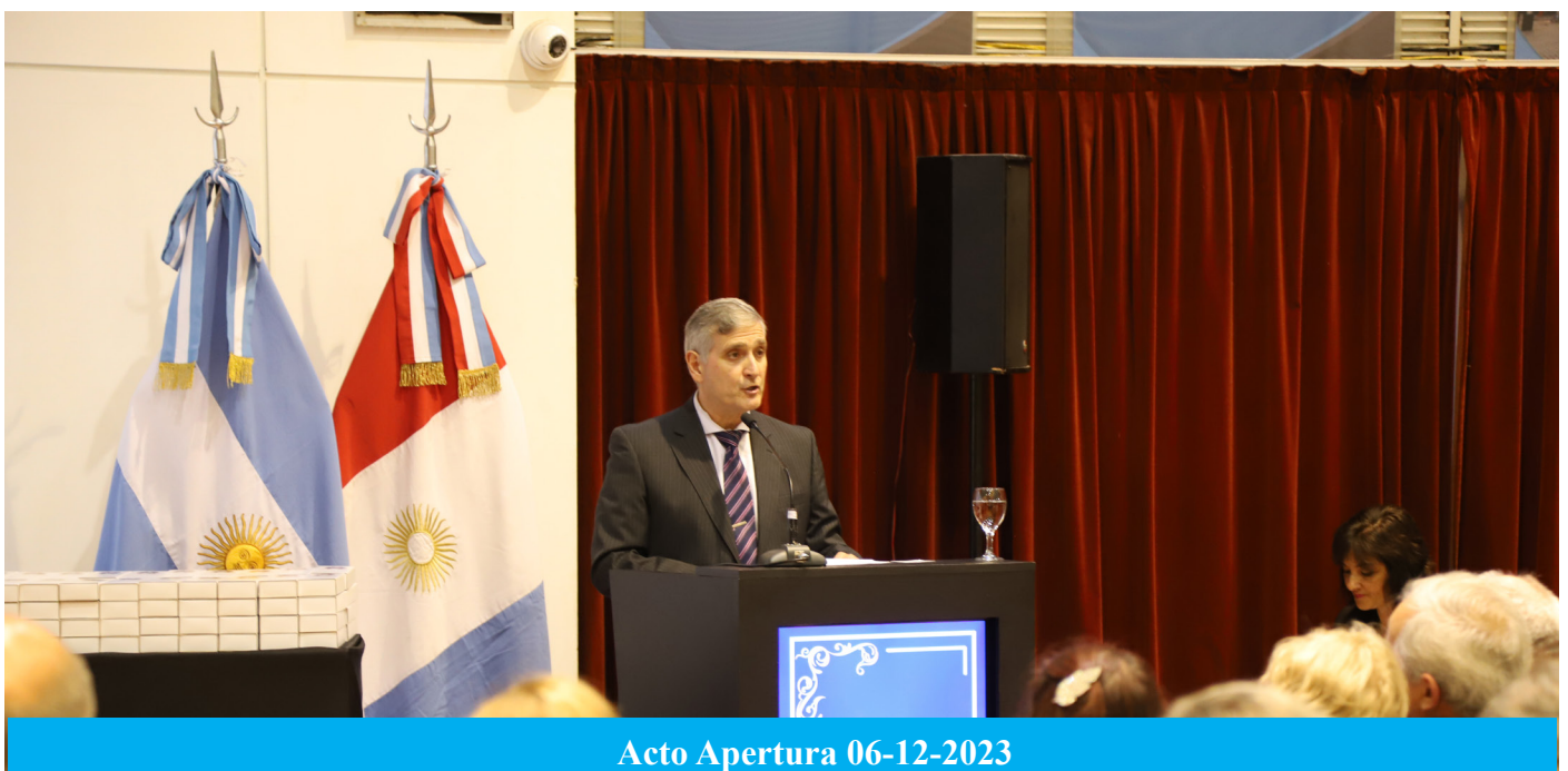
Acto Apertura 06-12-2023

Transcurrieron tiempos difíciles, pero aquel grupo de hombres y mujeres que tuvieron en 1982 el deseo de contribuir al bienestar de la comunidad de ciencias económicas con la creación de la Caja Complementaria, de crecer con la Ley 8.349 en 1993 y de perfeccionar el régimen con la reforma en el año 2012, continuaron comprometidos, identificando carencias y oportunidades en términos de seguridad social, enfocados en una visión de largo plazo para la profesión, y ello posibilitó sortear los desafíos burocráticos, políticos y económicos de la historia argentina, e imponer con convicción la defensa de un proyecto común y superador para la protección social de los afiliados y sus familias.