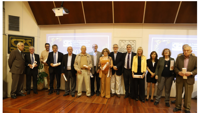
Directorios desde 1994 a 2002