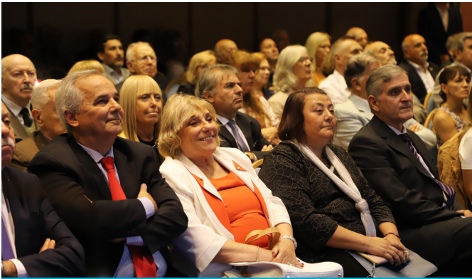
Acto 30º Aniversario