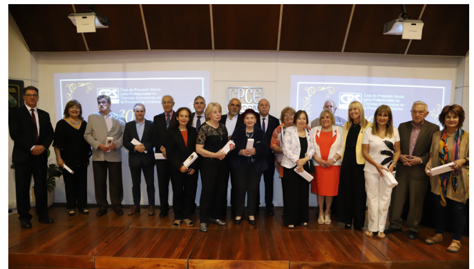
Directorios desde 2010 a 2016