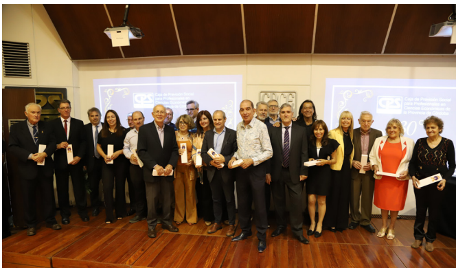
Directorios desde 2002 a 2010