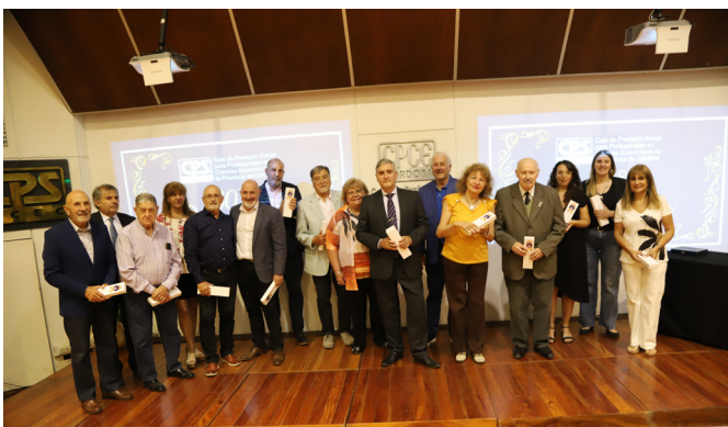
Directorios desde 2016 a 2022