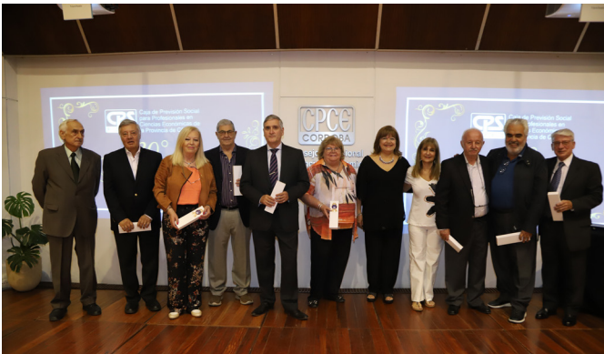
Directorios desde 1983 a 1993