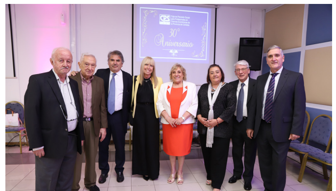
Ex Presidentes y Sec. Coordinadora de Cajas