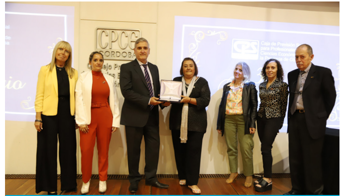
Reconocimiento de la Coordinadora de Cajas