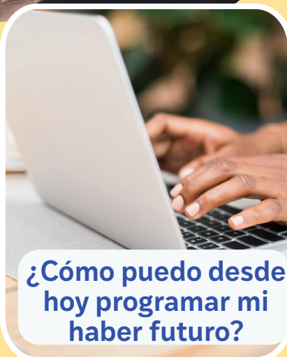
¿Cómo puedo desde hoy programar mi haber futuro?