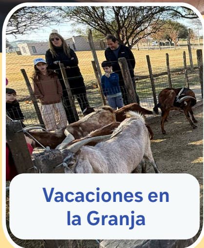
Vacaciones en la Granja