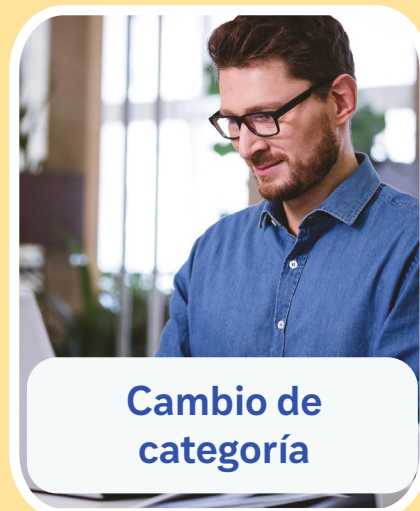
Cambio de categoría

Integridad, compromiso y acción orientados a tu futuro